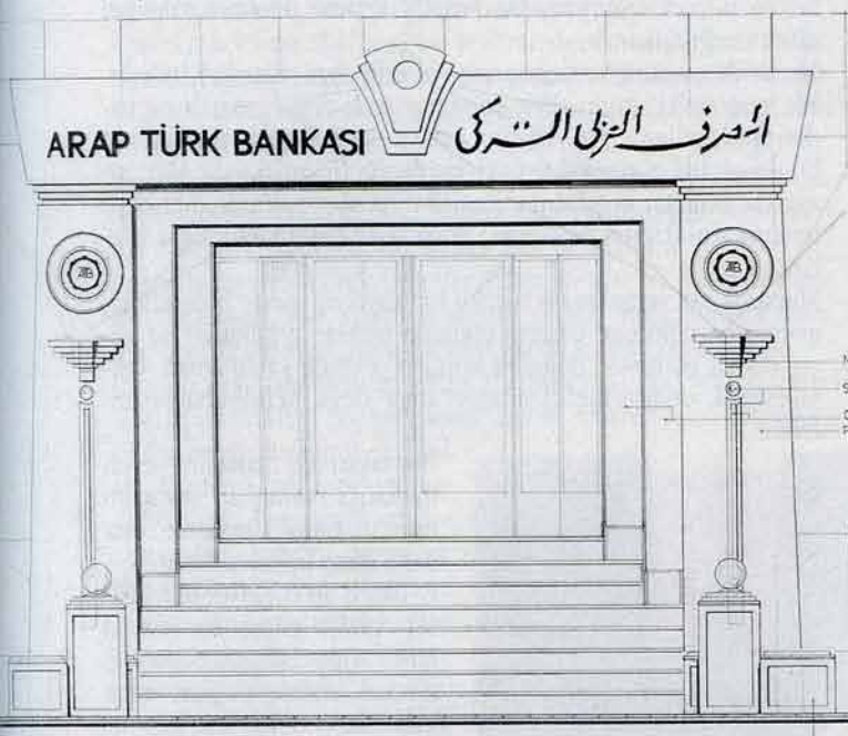
Giriş kapısı sistem detayı / Construction detail from main gate